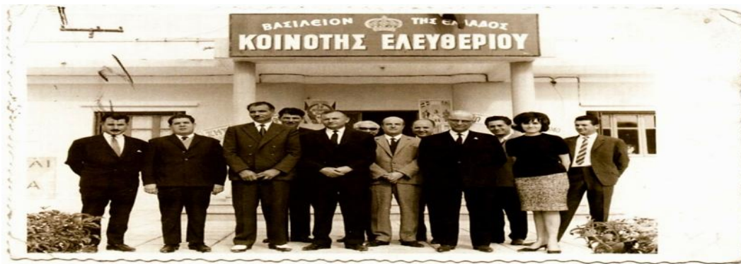
Το κτήριο του Κοινοτικού Συμβουλίου

6. Συλλογή πληροφοριών σχετικά με το Χαρμάνκιοϊ και το Νέο Κορδελιό από το 1922 έως σήμερα (ιστορία του Χαρμάνκιοϊ και του Κορδελιού μετά την εγκατάσταση των προσφύγων, γειτονικοί δήμοι που ιδρύθηκαν στην συνέχεια, δημότες, εκκλησίες, σχολικοί σύλλογοι, αθλητικοί σύλλογοι που ίδρυσαν οι πρόσφυγες, πολιτιστικοί σύλλογοι, παραδοσιακές εκδηλώσεις και έθιμα που αναβιώνουν μέχρι σήμερα στο Νέο Κορδελιό)