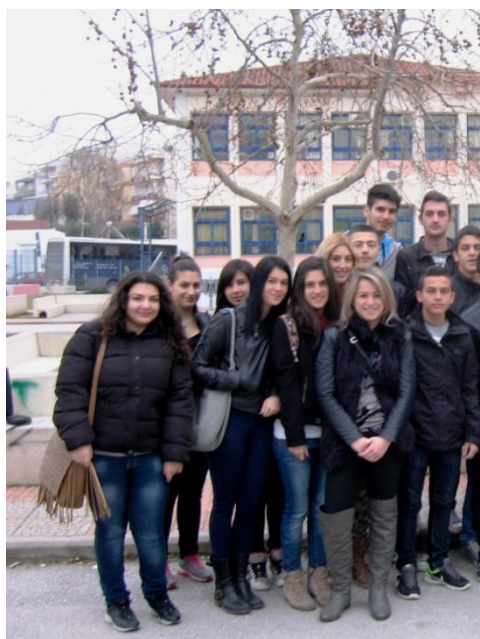
Μαθητές, μαθήτριες του Β΄ 2 - 2013