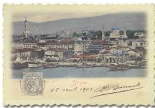
Όψη του λιμανιού. Το κωδωνοστάσιο της Αγίας Φωτεινής αριστερά επιβάλλεται με την παρουσία του.